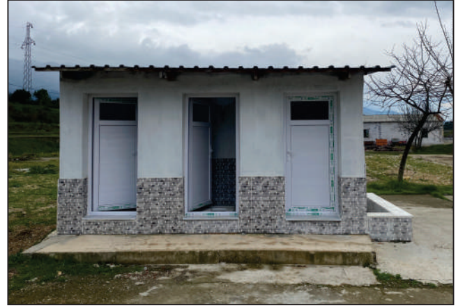
AKTEPE MAHALLESİ BARAJ ÇEVRE YOLU SOKAK BİNA TADİLAT ÇALIŞMASI ESKİ VE YENİ HALİ