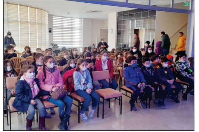
Ara Tatilde öğrencilere sinema gösterimi yapıldı.