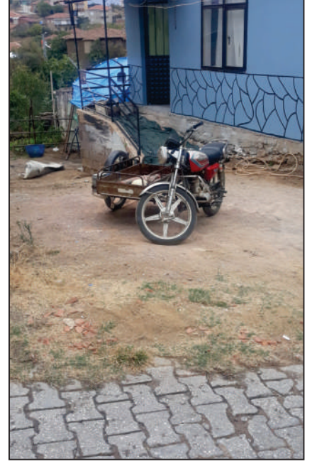
HALIKÖY MAHALLESİ NEHİR KÜME EVLERİ SOKAK KİLİT PARKE TAŞI DÖŞEME ÇALIŞMALARI ESKİ HALİ