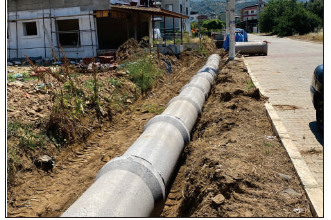
CUMHURİYET MAHALLESİ İNÖNÜ CADDESİ BÜZ ÇALIŞMASI ESKİ VE YENİ HALİ