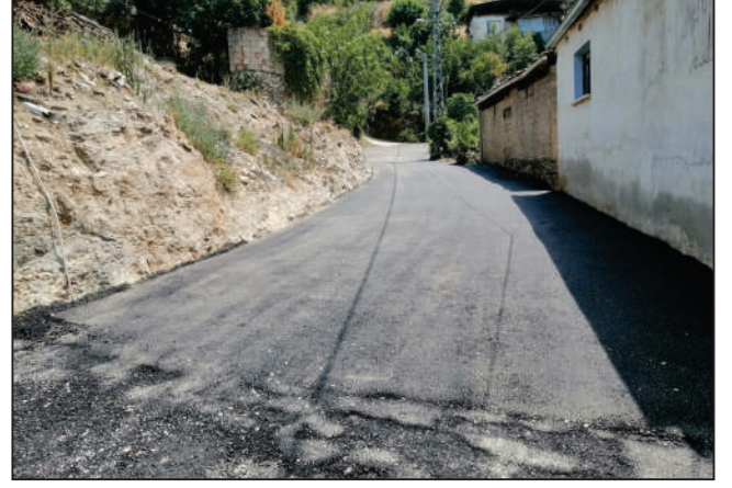
ADAKÜRE MAHALLESİ BAŞARI SOKAK ASFALT YAMA ÇALIŞMASI