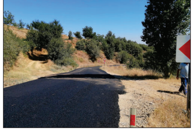
BEYKÖY MAHALLESİ KUVAYİ MİLLİYE YOLU ASFALT YAMA ÇALIŞMASI