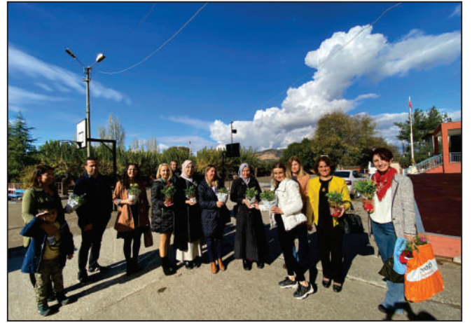
24 Kasım Öğretmenler Günü sebebiyle ilçemizde görev yapan öğretmenlere çiçek takdiminde bulunulmuştur.