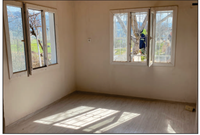
YUKARI TOSUNLAR MAHALLESİ GÜVEN KÜME EVLERİ SOKAK LOJMAN TADİLATI ESKİ VE YENİ HALİ