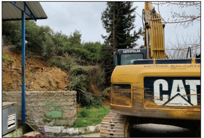
AKTEPE MAHALLESİ BARAJ KIR LOKANTASI ALAN GENİŞLETME ÇALIŞMASI ESKİ VE YENİ HALİ