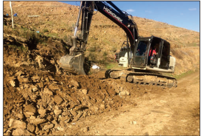
YAĞCILAR MAHALLESİ DUMAN GEDIĞİ MEVKİİ ÜRETİM YOLU AÇMA ÇALIŞMASI