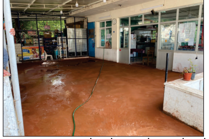
ÇOMAKLAR MAHALLESİ ÇOMAKLAR KÜME EVLERİ SOKAK KAHVE BAHÇESİ TADİLAT ESKİ VE YENİ HALİ