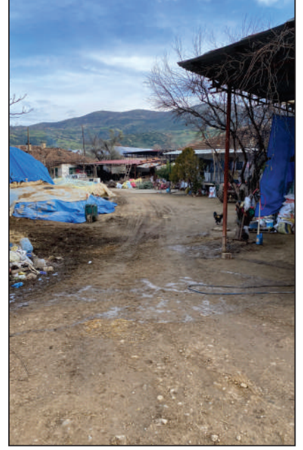
KARAOBA MAHALLESİ ÇİFTEKUYULAR KÜME EVLERİ SOKAK KİLİT PARKE DÖŞEME ÇALIŞMASI ESKİ HALİ