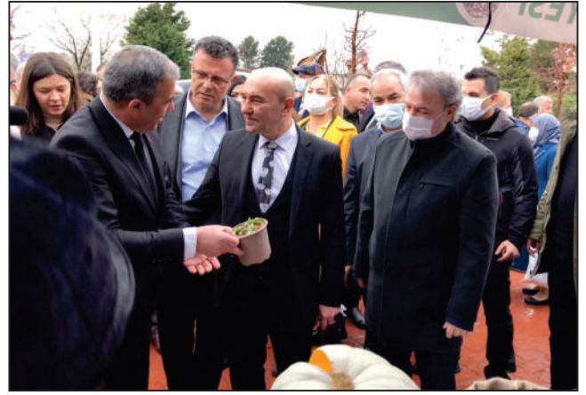
İzmir Büyükşehir Belediyesi tarafından Can Yücel Tohum Merkezi'nde gerçekleştirilen Tohum Takas Şenliğine katıldık