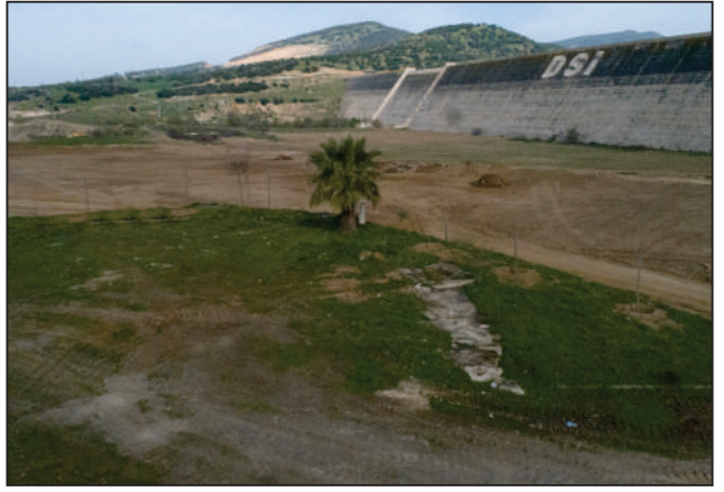
AKTEPE MH. BARAJ ÇEVRE YOLU SOKAK ŞANTİYE ALANI ÇEVRESİ ÇİT ÇEKME VE ALAN DÜZENLEME ESKİ VE YENİ HALİ