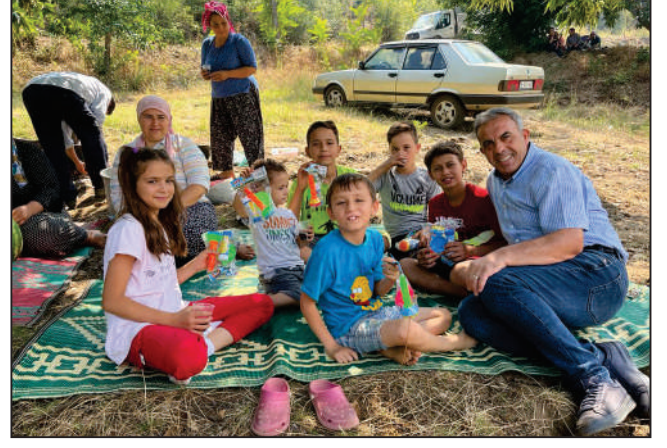
Çamlık Mahallemizin geleneksel olarak