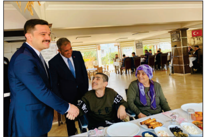
10-16 Mayıs Engelli Haftası dolayısıyla ilçemizde yaşayan engelli vatandaşlarımızda kahvaltıda buluştuk