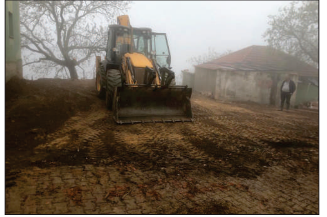
PALAMUTÇUK MAHALLESİ CEVİZDİBİ KÜME EVLERİ SOKAK BİNA YIKIMI ESKİ VE YENİ HALİ