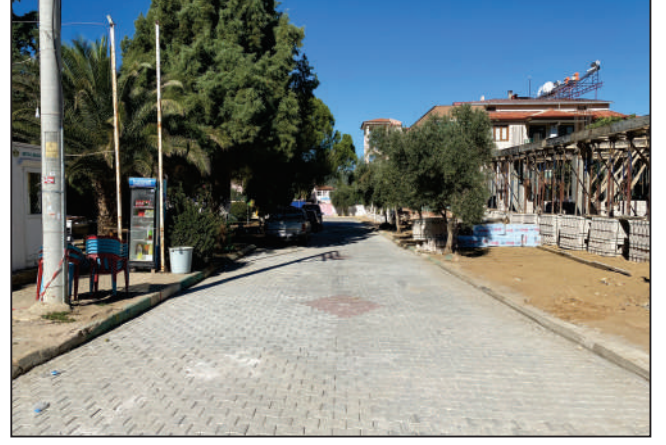
CUMHURİYET MAHALLESİ 2 EYLÜL KURTULUŞ PARKI SOKAK KİLİT PARKE YENİLEME ÇALIŞMASI ESKİ VE YENİ HALİ