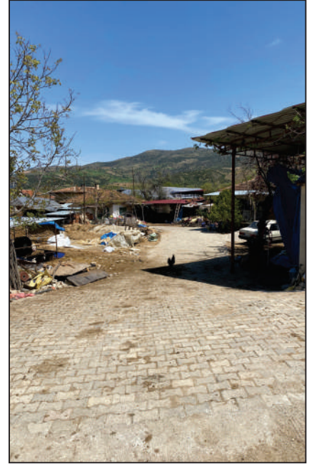
KARAOBA MAHALLESİ ÇİFTEKUYULAR KÜME EVLERİ SOKAK KİLİT PARKE DÖŞEME ÇALIŞMASI YENİ HALİ