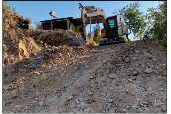
PALAMUTÇUK MAHALLESİ ÇAĞLAR KÜME EVLERİ SOKAK YOL AÇMA ÇALIŞMASI