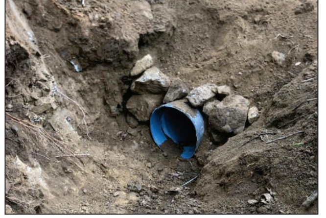
MUTAFLAR MAHALLESİ YUKARI KÜME EVLERİ SOKAK KORGE BORU DÖŞEME ÇALIŞMASI ESKİ VE YENİ HALİ