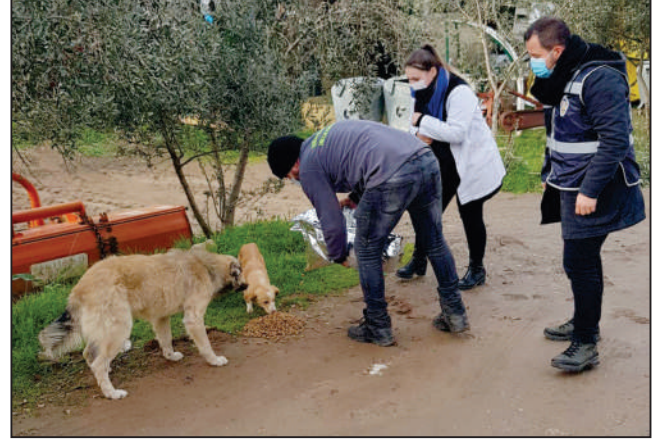
İlçe genelinde Belediyemiz Veterinerlik Hizmetleri tarafından sokak hayvanlarını besleme ve tedavi yapıldı