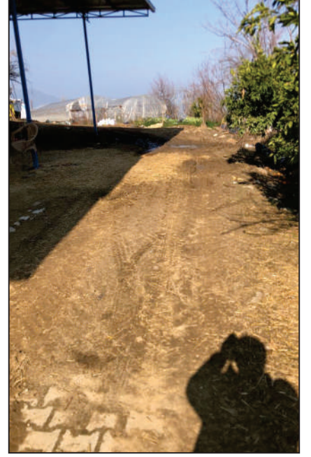
BAKIRKÖY MAHALLESİ KULLAR KÜME EVLERİ SOKAK KİLİT PARKE TAŞI DÖŞEME ÇALIŞMASI ESKİ HALİ