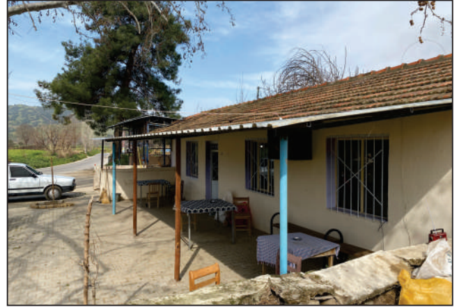
YAĞCILAR MAHALLESİ RÜZGAR KÜME EVELERİ SOKAK KAHVE ÖNÜ ÇATI ÇALIŞMASI ESKİ VE YENİ HALİ