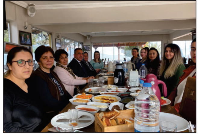
Beydağ'daki çalışan bayanların 8 Mart Dünya Emekçi Kadınlar Gününü kutladık