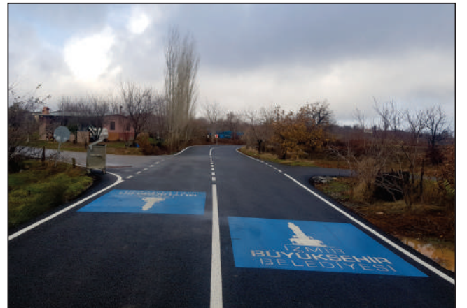
HALIKÖY MAHALLESİ OVACIK KÜME EVLERİ SOKAK SICAK ASFALT ÇALIŞMASI ESKİ VE YENİ HALİ