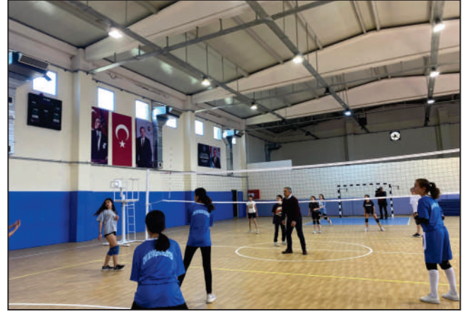
Beydağ Belediye Spor Kulübü Kız Voleybol takımına spor malzemesi ve ulaşım desteği sağlanmıştır