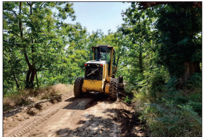
YOL BAKIM ONARIM ÇALIŞMALARI