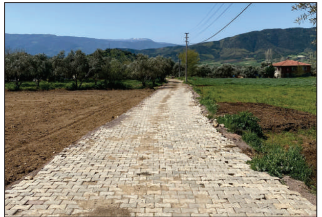
KURUDERE MAHALLESİ DOĞA KÜME EVLERİ SOKAK KİLİT PARKE TAŞI DÖŞEME ÇALIŞMASI YENİ HALİ