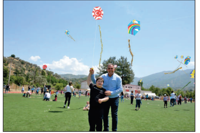
Belediyemiz tarafından Atatürk Stadında 2. Uçurtma Şenliği gerçekleştirilerek yarışmalı oyunlar, parkurlar, masal kahramanları, palyaço ve yüz boyama etkinlikleri düzenlendi