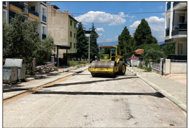
YOL BAKIM ONARIM ÇALIŞMALARI