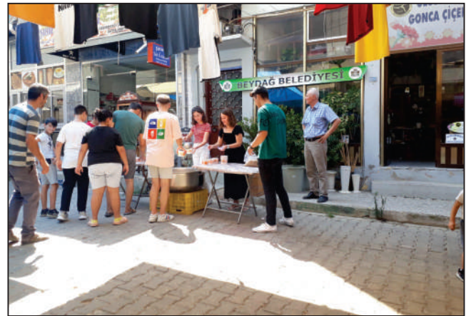
Muharrem ayı münasebetiyle Perşembe Pazarı'nda Aşure İkramında bulunduk