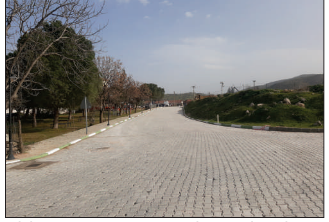
AKTEPE MAHALLESİ KÖPRÜBAŞI MEVKİ SOKAK KİLİT PARKE ÇALIŞMASI ESKİ VE YENİ HALİ