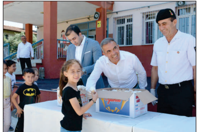
2021-2022 Eğitim-Öğretim yılının son haftasında öğrencilerimizin yüzünü güldürebilmek