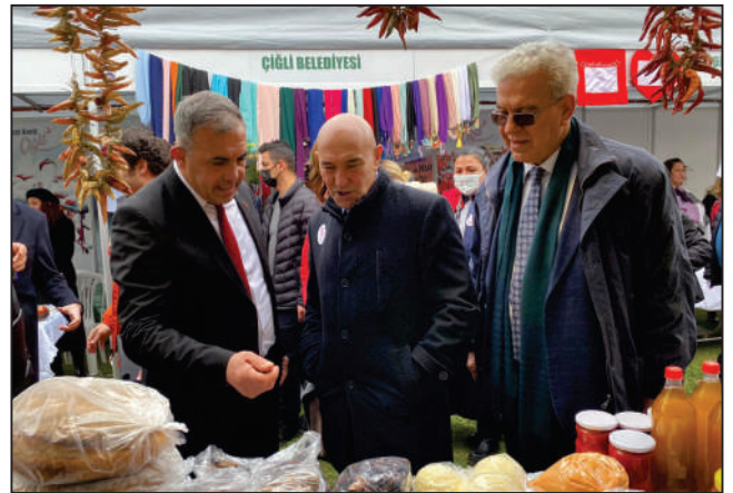
İzmir Büyükşehir Belediyesi tarafından düzenlenen 8 Mart Dünya Emekçi Kadınlar Günü etkinliklerine katıldık