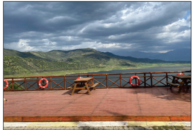
AKTEPE MAHALLESİ BARAJ KIR LOKANTASI İSKELE TAMİRİ