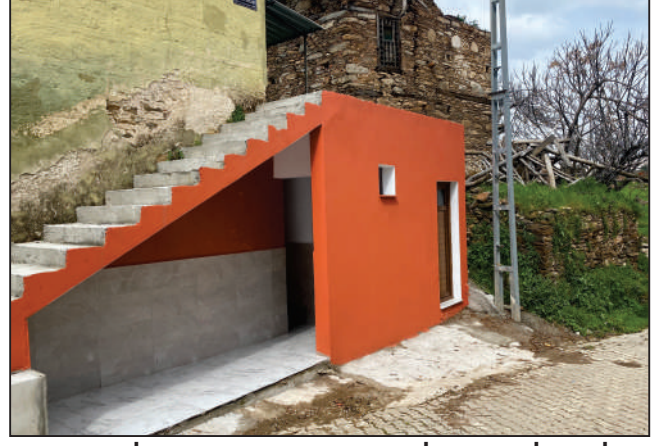
ALAKEÇİLİ MAHALLESİ BAŞAK KÜME EVLERİ SOKAK UMUMİ TUVALET YAPIMI ESKİ VE YENİ HALİ