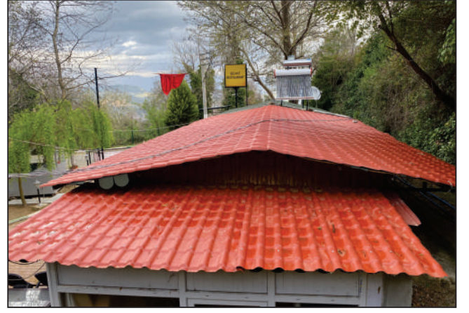
BEYKÖY MAHALLESİ KUVAYİ MİLLİYE YOLU ŞELELE RESTORNAT ÇATI TADİLATI ESKİ VE YENİ HALİ