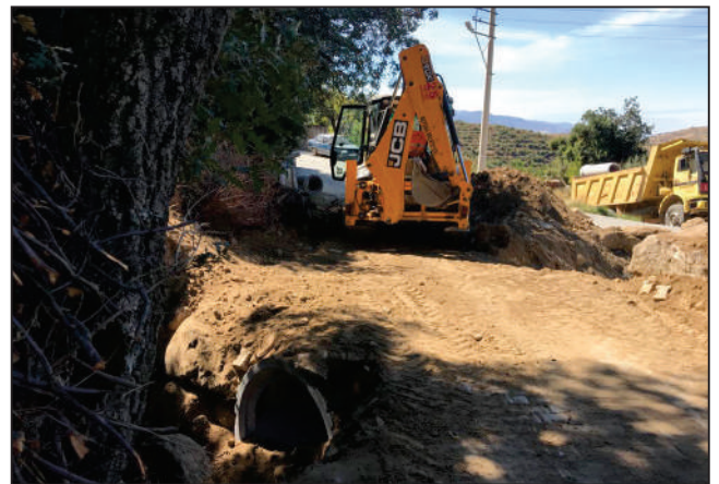
YEŞİLTEPE MAHALLESİ DERİN KÜME EVLERİ SOKAK BÜZ DEĞİŞİMİ ESKİ VE YENİ HALİ