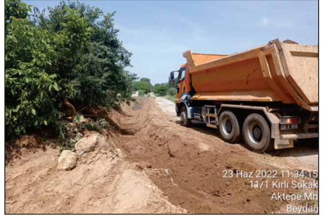
DERE TEMİZLİK İSLAH VE TAHKİMAT ÇALIŞMALARIMIZ