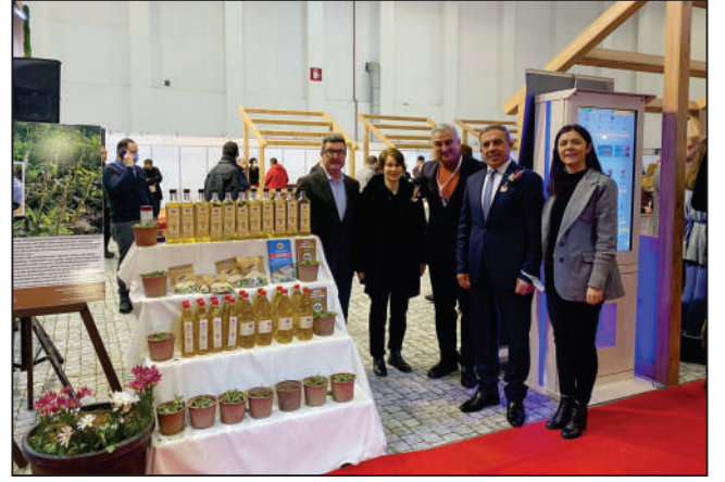
Türkiye'nin en büyük, Avrupa'nın dört büyük tarım fuarı katılım sağladık.