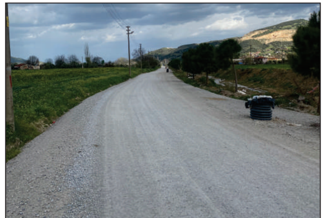
CUMHURİYET MAHALLESİ-YUKARITOSUNLAR MAHALLESİ ARASI BAĞLANTI YOLU ALT YAPI ÇALIŞMASI ESKİ VE YENİ HALİ