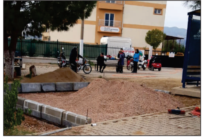
AKTEPE MAHALLESİ KÖPRÜBAŞI MEVKİİ SOKAK BÜFE YERİ DEĞİŞİMİ ESKİ VE YENİ HALİ