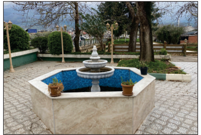
AKTEPE MAHALLESİ ÖDEMİŞ YOLU SOKAK GAZİNO BAHÇESİ HAVUZ TADİLATI ESKİ VE YENİ HALİ