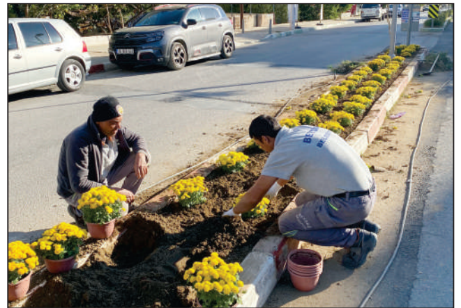
PARK BAHÇELER BAKIM VE MEVSİMLİK ÇİÇEK-AĞAÇ DİKİMİ ÇALIŞMALARI ÇALIŞMALARI