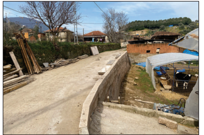
HALIKÖY NAHALLESİ NEHİR KÜME EVLERİ SOKAK YOL PERDE BETON ÇALIŞMASI ESKİ VE YENİ HALİ