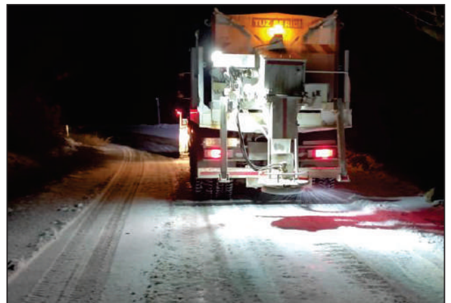
MAHALLERİMİZDE YAŞANAN DOĞAL AFETLERLE İLGİLİ MÜCADELE ÇALIŞMALARIMIZ