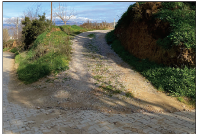
KURUDERE MAHALLESİ DOĞA KÜME EVLERİ SOKAK KİLİT PARKE TAŞI DÖŞEME ÇALIŞMASI ESKİ HALİ