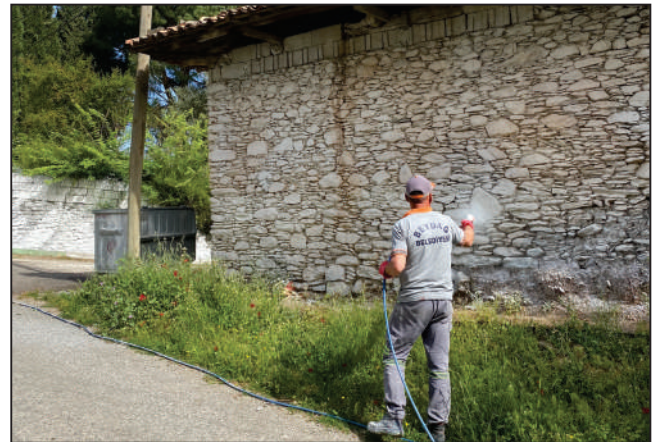
CADDE-SOKAK-DURAK- KÖPRÜ-KORKULUK VE BORDÜR BOYAMA ÇALIŞMALARI