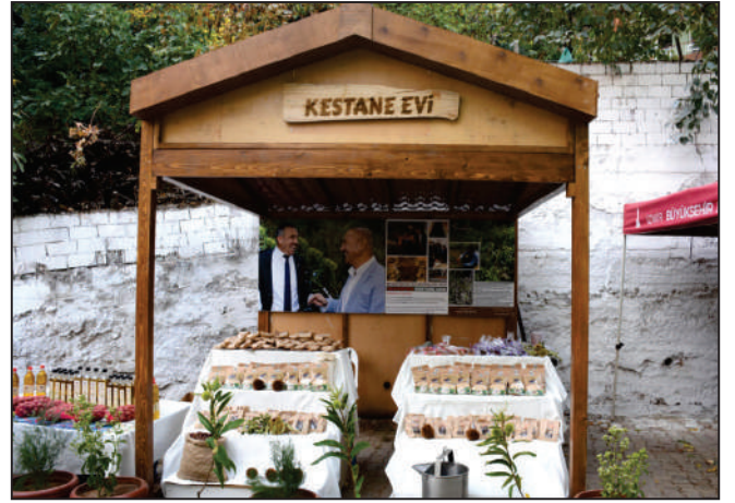
İlçemiz ekonomisinde büyük bir pay sahibi olan kestanenin tanıtılması amacıyla, İlçemiz Çomaklar Mahallesinde 3. Kestane Festivali gerçekleştirilmiştir.