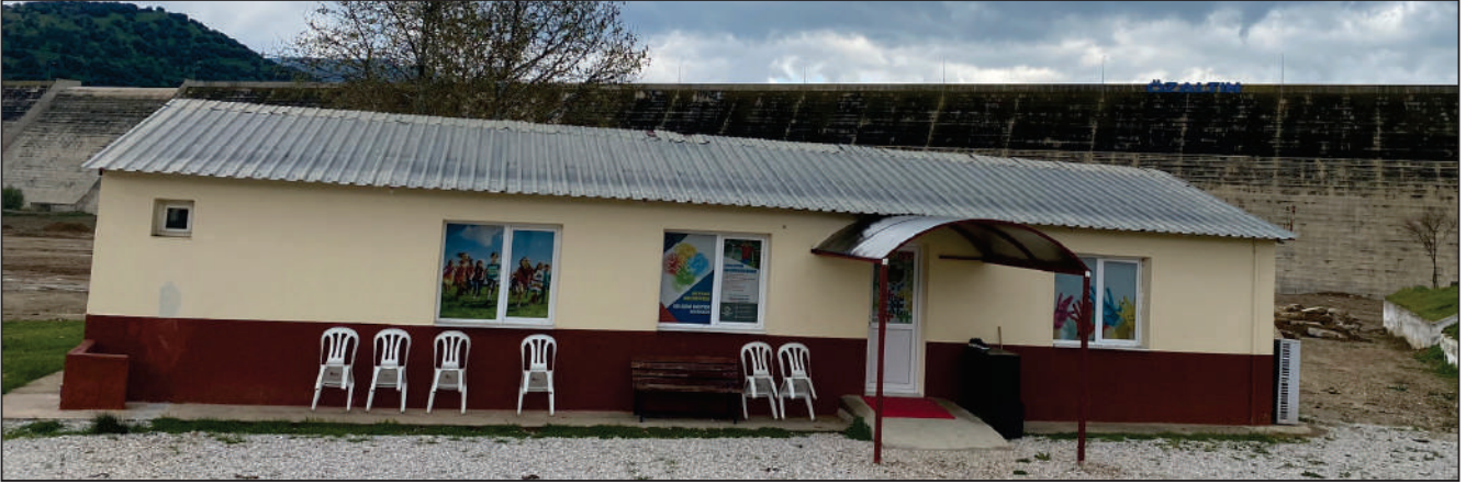
AKTEPE MAHALLESİ BARAJ ÇEVRE YOLU SOKAK BİNA TADİLAT ÇALIŞMASI YENİ HALİ