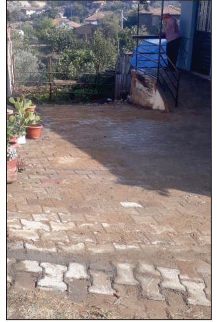
HALIKÖY MAHALLESİ NEHİR KÜME EVLERİ SOKAK KİLİT PARKE TAŞI DÖŞEME ÇALIŞMALARI YENİ HALİ