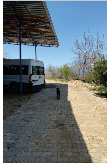
BAKIRKÖY MAHALLESİ KULLAR KÜME EVLERİ SOKAK KİLİT PARKE TAŞI DÖŞEME ÇALIŞMASI YENİ HALİ