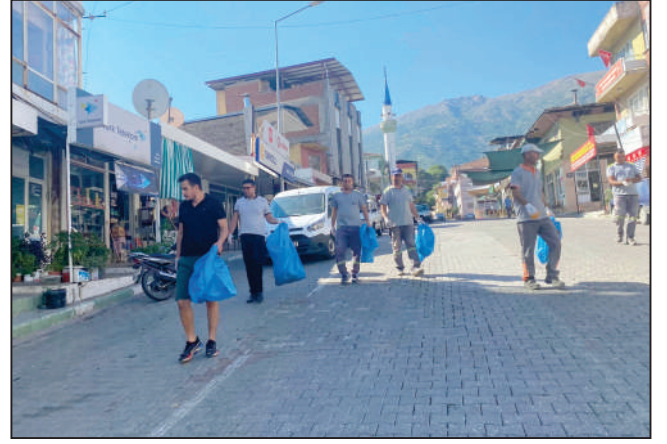
Sen, Ben, Hepimiz! Tertemiz İzmir'imiz sloganıyla Beydağ'da temizlik yapıldı.