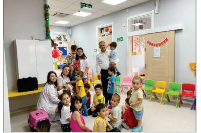
Beydağ Adile Şen Anaokulu ve İzelman Beydağ Kreş ve Anaokulu Eğitim Merkezi öğrencilerine Belediyemiz veteriner hekimi tarafından sokak hayvanları hakkında bilgilendirme yapılmıştır