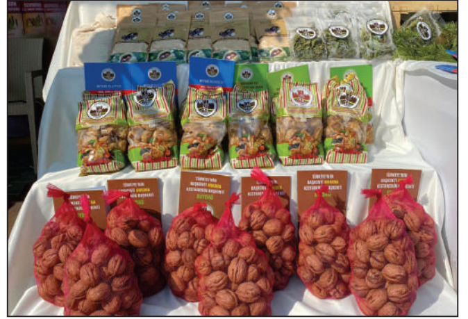
İlçemizin tanıtımının yapılması amacıyla İzmir Enternasyonal Fuarı'nda düzenlenen Terra Madre Anadolu İzmir 2022 fuarına katılım sağlandı.