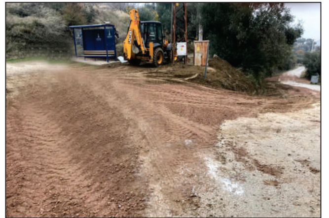
MUTAFLAR MAHALLESİ YÖRÜKLER KÜME EVLERİ SOKAK KORGE BORU DÖŞEME ÇALIŞMASI ESKİ VE YENİ HALİ