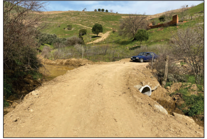
YAĞCILAR MAHALLESİ DUMAN GEDİĞİ MEVKİİ BÜZ DÖŞEME ÇALIŞMASI ESKİ VE YENİ HALİ