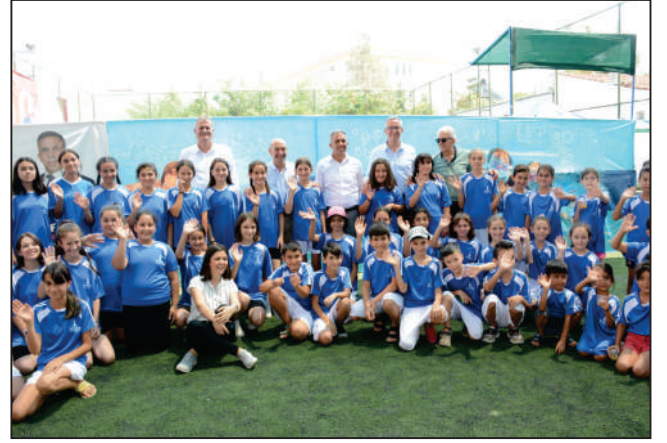
İzmir Büyükşehir Belediyesi Spor Dairesi Başkanlığı